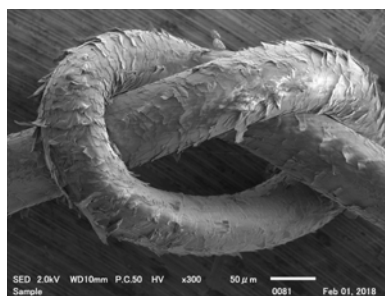
DiSM未配合透明シャンプー処理